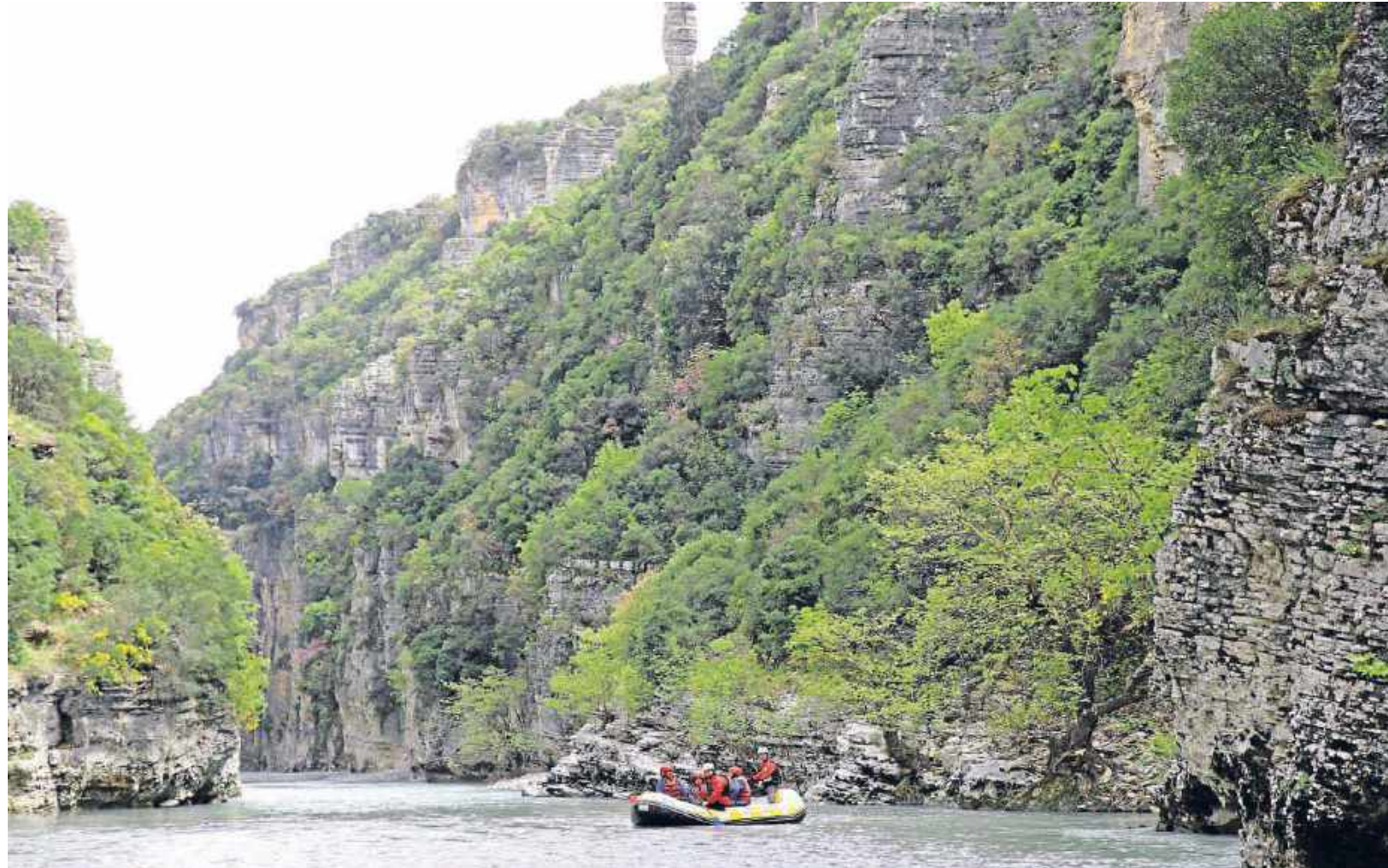
Der spektakuläre Osum Canyon eignet sich toll für Rafting-Ausflüge

Gleich am Eingang stehen Mühlen, in denen er Getreide für Brote mahlt. Gerade einmal